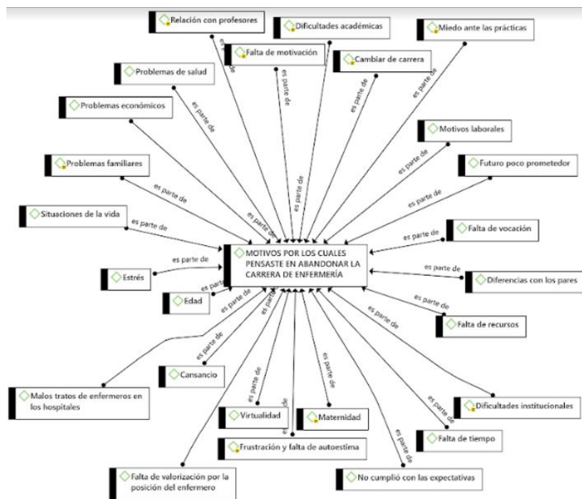
Imagen 2: motivos que generan querer abandonar la carrera de Enfermería por parte de los estudiantes.

Para finalizar, este estudio es descriptivo, por lo que resulta importante dedicar tiempo al análisis y a la generación de políticas y tecnologías que tiendan a reducir la deserción de estudiantes, a partir de estos hallazgos (López Lebrón y Torrès Pagán, 2022 y Mthimunye y Daniels, 2019).