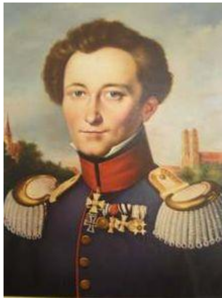
Carl Von Clausewitz (1780– 1831) General prusiano, pensador y destacado teórico de la guerra moderna

“(...) En la estrategia todo resulta muy simple, pero no por ello muy fácil. Una vez que, por las relaciones de Estado, se determina lo que la guerra podrá y tendrá que ser, entonces el camino para alcanzar esto será fácilmente encontrado; pero seguirlo en línea recta, llevar a cabo el plan sin verse obligado a desviarse mil veces por mil influencias variables, requiere, además de fuerza de carácter, una gran claridad y firmeza mental.”