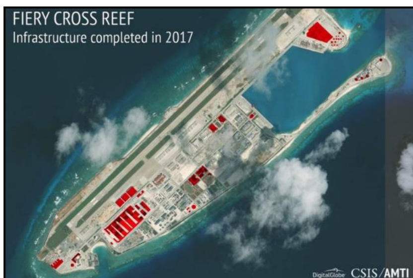
Figura 7 – Construcciones artificiales en arrecife Fiery Cross.

Las imágenes que muestran las impresionantes instalaciones militares que Pekín construye en tiempo récord en las islas del mar de China Meridional.