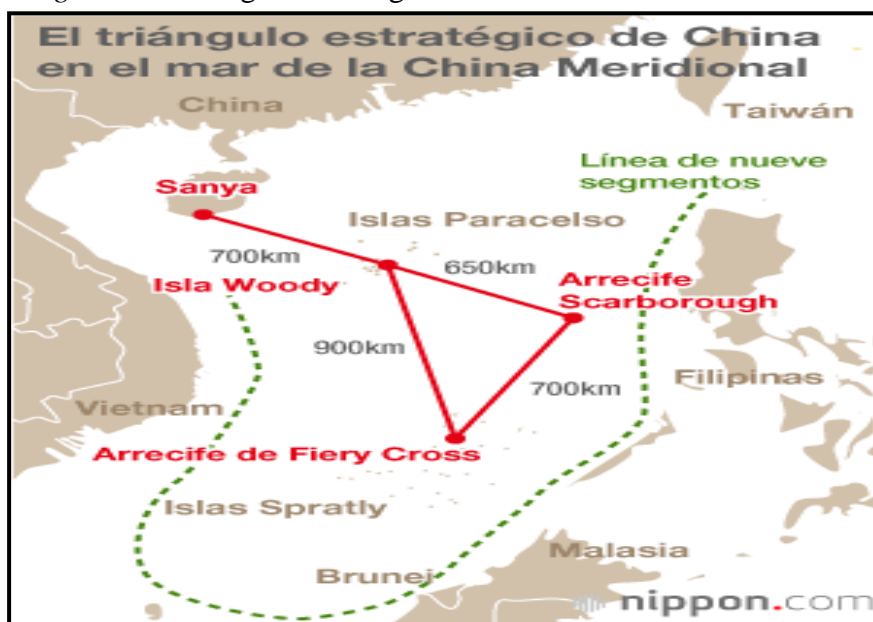
Figura 5 – Triángulo estratégico en el Mar de China Meridional.