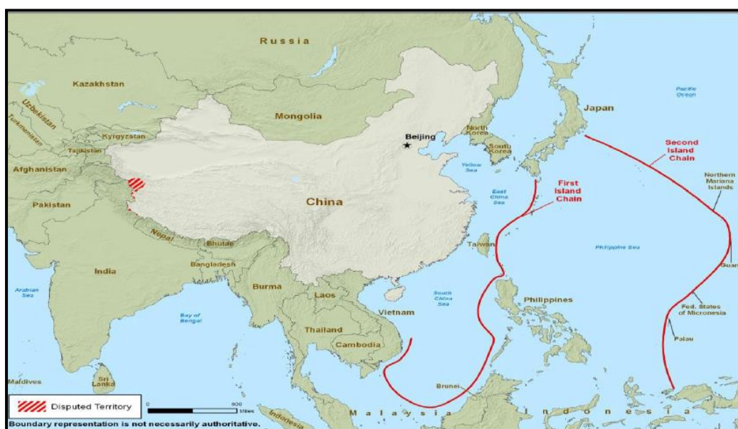
Figura 6 – Líneas Defensivas del ELP.

Fuente: (Alcalde, 2018). La expansión naval china en el Mar de la China Meridional.