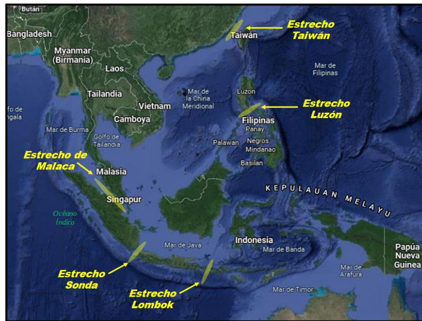
Figura 3. Posición geográfica de los Estrechos del Sudeste Asiático.