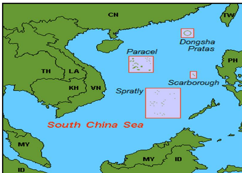
Figura 4 - Mar de China Meridional: archipiélagos, arrecifes, islas y rocas.

Fuente: (Wikipedia, s.f) Línea de los nueve puntos.