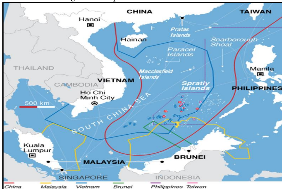
Figura 1. Mapa de reclamaciones territoriales.