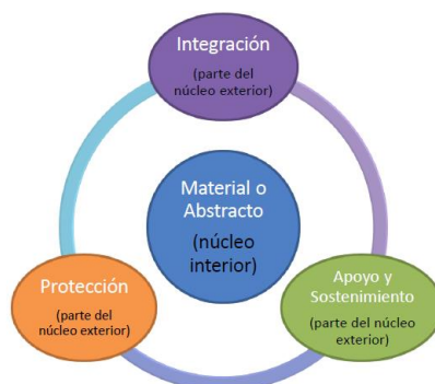
Figura 2: “Composición del CDG según Vego”.(Gniesko, 2017, pág. 53).

Vego define el centro de gravedad como “Una fuente de fortaleza física o moral, la que seriamente degradada, dislocada, neutralizada o destruida podría tener el mayor impacto decisivo sobre la habilidad del enemigo o de la propia fuerza para cumplir la misión”(Vego M. , 2008, pág. 13). También expresa que el centro de gravedad está compuesto por dos partes, “núcleo interior y núcleo exterior”. El núcleo interior, contiene el centro de gravedad material o abstracto, mientras que el núcleo exterior se asocia al núcleo interior con los requerimientos críticos, que permiten desarrollarse al centro de gravedad, como se observa en la Figura 2.