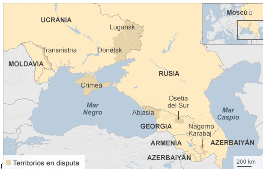
(Conflictos en el espacio Post Soviético) 13