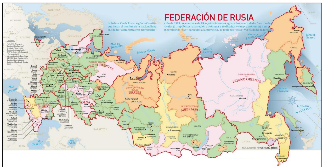
(Mapa de la Federación de Rusia) 1

Dos años después de perder a sus Estados Satélites en Europa, la URSS sufrió una reducción territorial y demográfica de grandes proporciones en Europa Oriental y muy sensiblemente en la región centroasiática, donde perdió casi cuatro millones de km 2 y 50 millones de habitantes.