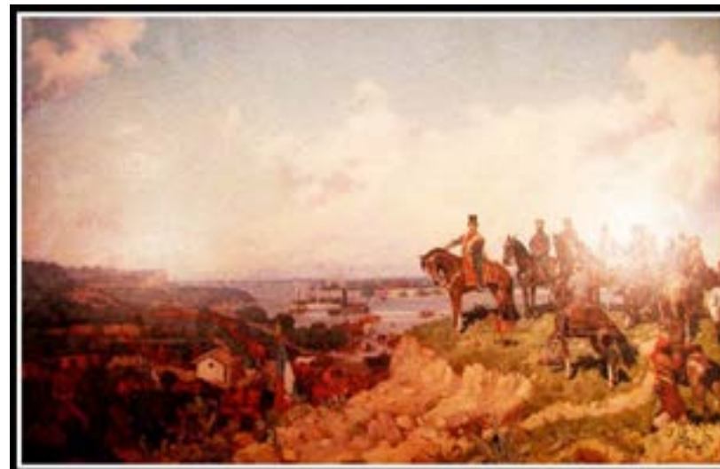
Figura 2: cuadro “El gran cruce del río Paraná” de Emilio Caraffa (1895).

“el sol de ayer ha iluminado uno de los espectáculos más grandiosos que la naturaleza y los hombres pueden ofrecer, el pasaje de un gran río por un grande ejército” 27 .