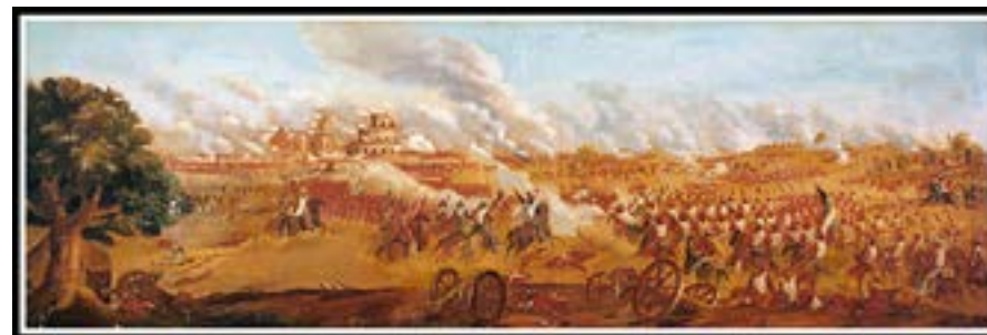
Figura N°5: cuadro Batalla de Caseros / Final del Combate

y faltos de municiones, pero con el objetivo de retirarse hacia Buenos Aires o de obtener una honrosa capitulación, hicieron un cambio de frente dejando a sus espaldas el camino a Buenos Aires y procedieron a continuar el combate contra la División Galán y otras que allí se encontraban y que trataban de envolverlos.