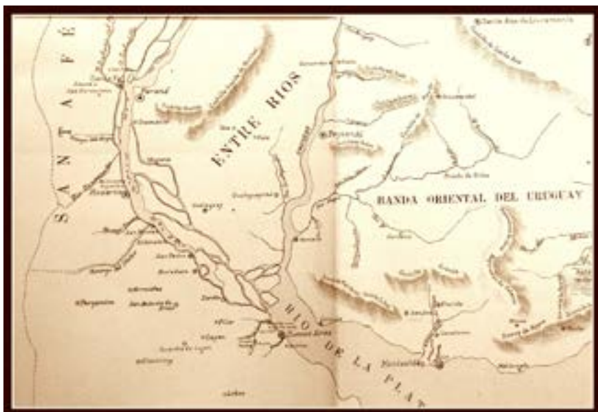
Figura N°1: Mapa de la Época.